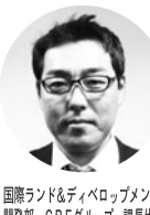
保有しているビルが、旧耐震基準の