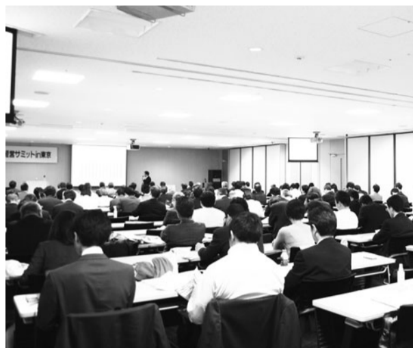
▲会場はほぼ満席となった

3月の東北地方大平洋沖地震を契機に、注目度が一気に高まっているビルの防災対策。今も大きな余震が続いている中、建物の利用者、そして躯体そのものを守るために、オーナーが取るべき行動とは何か。今回のビル経営サミットでは各方面から専門家を招き、来場者と共に考えるべき巨大地震への備えを考えるイベントとなった。