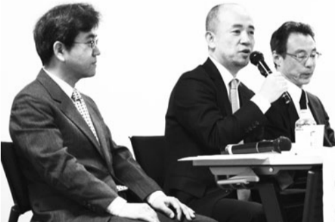
聴講者に語りかける