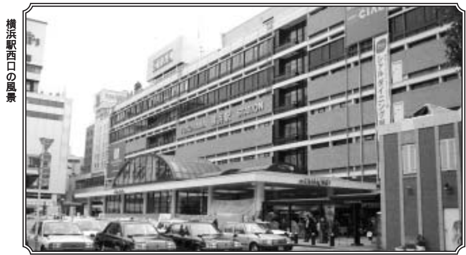
横浜駅西口の風景

7路線が乗り入れ、横浜市の中心地として常に神奈川県をリードし続ける横浜駅周辺エリア。1日約200万人という駅の乗降客数が示す通り、駅周辺は平日・休日問わず、人で溢れ、オフィス・商業ビルは共に高稼働中だ。発展著しいみなとみらいエリアとの連動が、今度どのように進んでいくのか。地元ビルオーナー達は、固唾を飲んで見守っている状況にある。