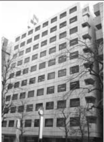
所在地 神奈川県横浜市西区北幸2-10-39 本紙寸評 重厚な存在感を持つビル。

建物概要 竣工 昭和62年7月 設計 不二建設 施工 不二建設 規模 地下1階地上10階 オーナー 日総ビルディング 管理 日総ビルディング 敷地面積 1032㎡ 延床面積 6679㎡ テナント イスト、伊藤忠アーバンコミュニティ、エアィネット・テクノロジー、神奈川県情報サービス産業厚生年金基金、神奈川県情報サービス産業厚生年金基金健康保険組合、クチーナ横浜、クレディセゾン、セコム、セコムジャスティック、セコム損害保険、セゾン情報システムズ、総合メディカル、玉川製作所、日本コムシス、日総ビルディング、ピシステム・イー、ヒューマンプラス、ミツイワ、ユアサ商事