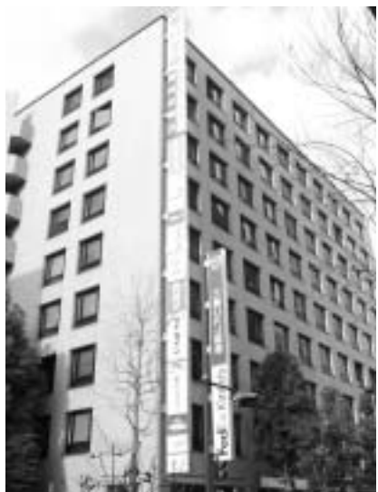
所在地 神奈川県横浜市西区北幸1-11-11 本紙寸評 茶色いタイル張りの外壁がシックな印象を与える。

建物概要 竣工 昭和60年10月 規模 地下1階地上9階 オーナー 野村不動産オフィスファンド投資法人他 管理 野村ビルマネジメント 敷地面積 1502㎡ 延床面積 1万0055㎡ テナント アイライン、朝日生命保険相互会社、アシスト、オリカキャピタル、共栄セキュリティーサービス、共和テクノ、コスメディア、三幸福祉カレッジ、シティズ、スタッフアイ、スタッフバンク、すまい、積水ハウス、セレブリックス、セントメディア、東急リロケーション、日本医療事務協会、日本ガイシ、日本ギア工業、日本公文教育研究会、野村不動産アーバンネット、阪急交通社、フェデックスキンコース、福井銀行、富士通化成、プロクエスト、ベルシステム24、ベルリッツスクール、三菱UFJ証券 所在地 神奈川県横浜市西区北幸1-11-11 本紙寸評 茶色いタイル張りの外壁がシックな印象を与える。