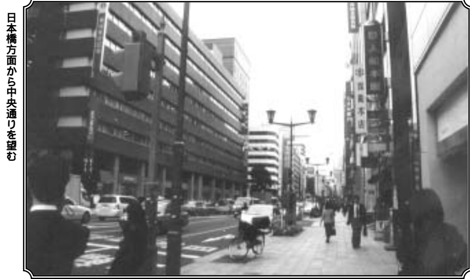
日本橋方面から中央通りを望む

東京駅からの利便性も良く、戸田建設や、味の素など多くの大企業が本社を構え、各地方都市の自治体も事務所を構えるなど、京橋エリアはオフィス街として依然根強い人気を保っていることがわかる。今年に入り、日土地京橋ビルや京橋TDビルが完成し、来年にはオービック本社ビルや明治製菓京橋本社ビルが竣工予定となっており、まだまだオフィスエリアとしての発展が見られる。今回は近年竣工したビルを中心に京橋エリアを見て行く。