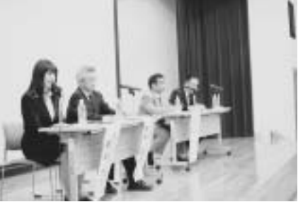
パネルディスカッションの様子